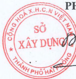
Vũ Hữu Thành